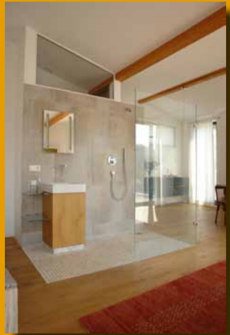
Neuzeitliches „Badehaus“ der Schreinerei Heizmann (um 2010)